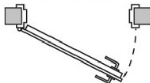
Pántok bal oldalon