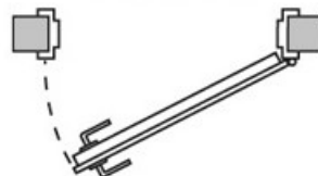
Pántok jobb oldalon